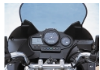
Das Cockpit der TDM ist übersichtlich gestaltet.

1000, 10.000, dann alle 10.000 Kilometer.