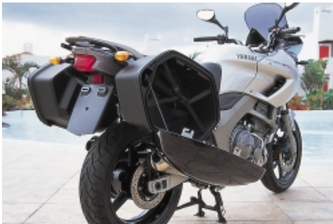
Durch Vergrößerung der Bohrung misst der Reihentwin nun 897 Kubikzentimeter Hubraum. Benzineinspritzung und geregelter Kat sind zeitgerecht. Die Koffer gibt es im Yamaha-Zubehör.

bahn locker ausreichen. Die bekannten Lastwechselreaktionen wurden zwar gemindert, sind aber immer noch nicht ganz verschwunden. Zwischen 2500 und 3000 Touren macht sich leichtes Schieberuckeln bemerkbar. Ab 3000/min geht's dann aber sportlich zur Sache. Dazu passt das gut schaltbare Sechsganggetriebe (früher fünf Gänge).